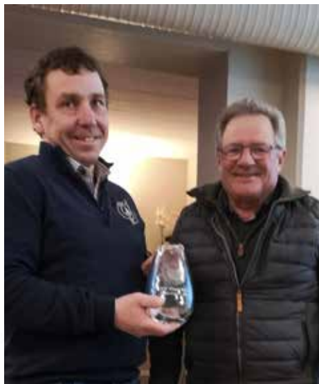
Årets TFK hund VK 2023 - premie ved årets GF