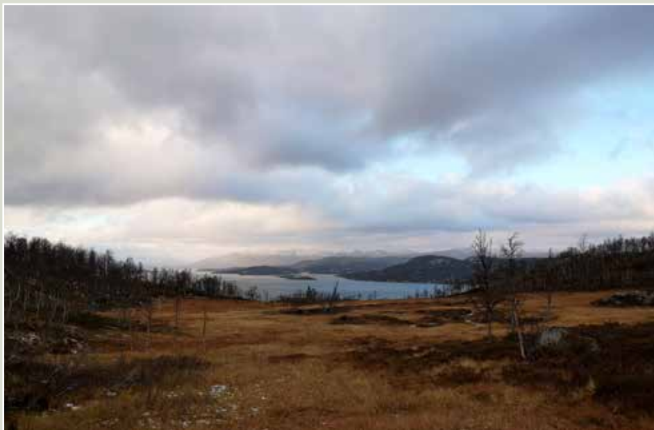
Skinnarbuterrenget mot Møsvatn