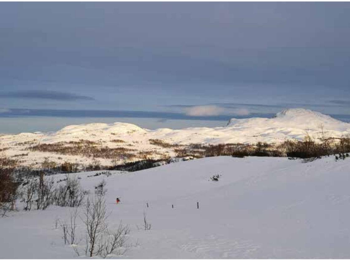
Bosnuten sett fra vest