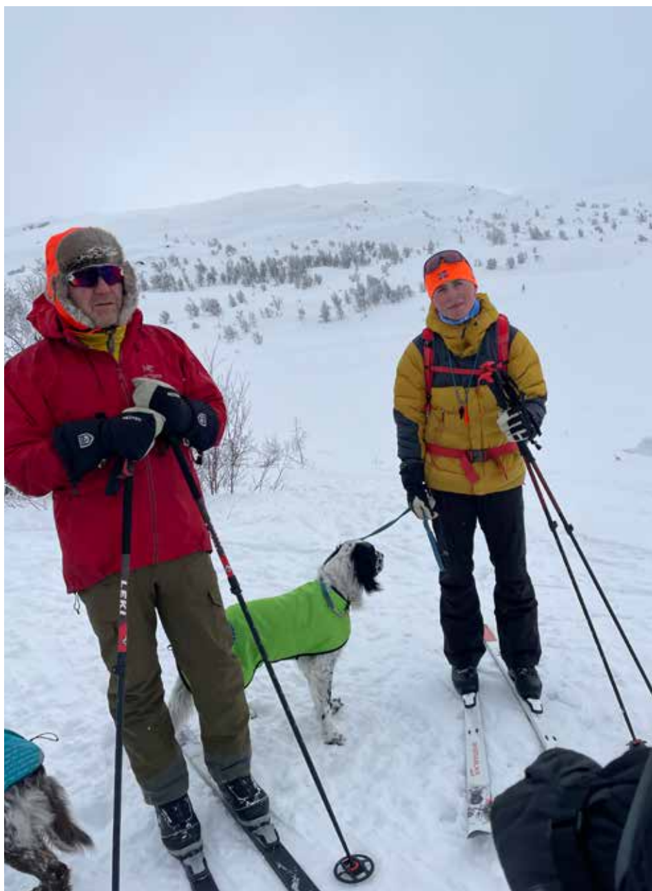
Fellestrening mars 2024