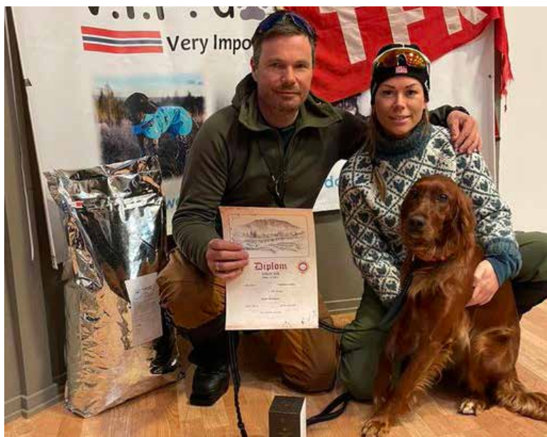
Vinner VK fin Vinter 2