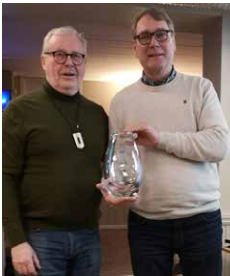
Vinner Televasen 2023 på årets generalforsamling