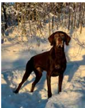
Årets TFK-hund AK KV Suldlørens AES Urho