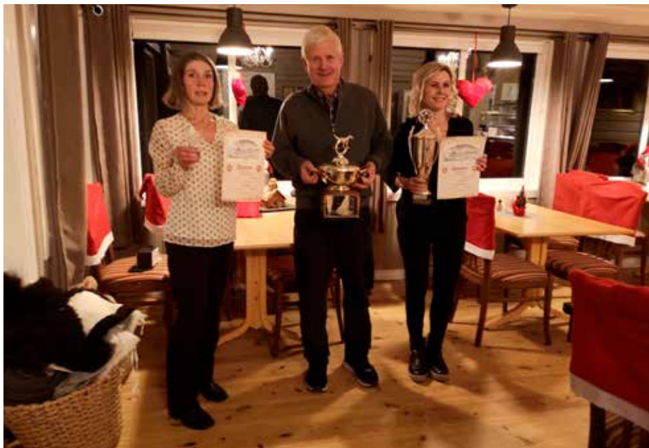
Premieutdeling på Kikut etter klubbmesterskapet

Deretter kunne alle benke seg rundt flott dekkede småbord og vi fikk deretter servert den tradisjonelle juleallerken som alltid smaker like godt. Dessert også som sedvanlig riskrem og kaffe. Praten gikk løst rundt bordene denne flotte førjulskvelden. Takk til vertskapet på Kikuthytta for nydelig mat, utmerket service og trivelig atmosfære.